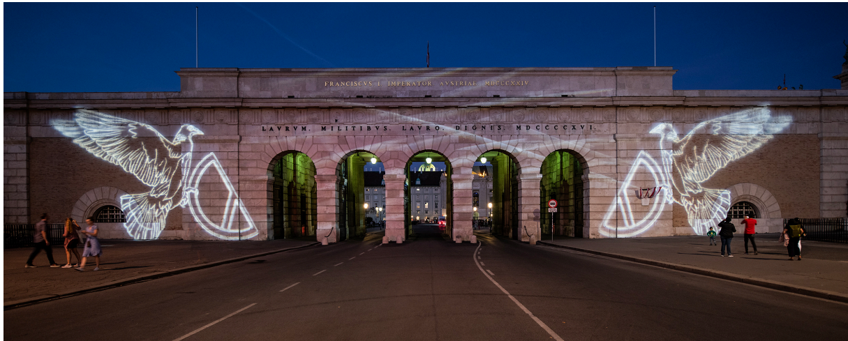
Chromotop Heldenor, Lichtgrafik Deborah Sengl, Wiener Lichtblicke 2023, Foto NIPAS/Helmut Prochart, Bildrecht 2023